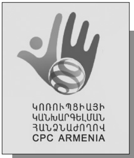
ԿՈՐՈՒՊՑԻԱՅԻ ԿԱՆՔԱՐԳԵԼՄԱՆ ՀԱՆՁՆԱԺՅՈՎՈՎ CPC ARMENIA

Կոռուպցիայի կանխարգելման հանձնաժողովը պետական եւ տեղական ինքնակառավարման մարմիններից հաշվետու ժամանակահատվածում 721 ծանուցումների հիման վրա ստացել է հայտարարագրման համակարգ է մուտքագրել 1963 հայտարարատու պաշտոնատար անձանց՝ պաշտոնի նշանակվելու կամ պաշտոնից ազատվելու վերաբերյալ տվյալներ, որոնք վերաբերում են 2843 փոփոխությունների: Վերը նշված փոփոխություններից 1423-ը եղել են պաշտոնեական պարտականությունները ստանձնելու, 1420-ը՝ պաշտոնեական պարտականությունները դադարեցնելու մասին: Հաշվետու ժամանակահատվածի վերջի դրությամբ համակարգում գրանցված, գործող պաշտոնատար անձանց թիվը կազմել է 6158: Ըստ Հանձնաժողովի հաշվետվության՝ հայտարարատու պաշտոնատար անձանց պաշտոնի նշանակվելու կամ պաշտոնից ազատվելու վերաբերյալ ծանուցումների տվյալներում մշտապես առկա են եղել մի շարք խնդիրներ, մասնավորապես, պետական եւ տեղական ինքնակառավարման մարմինների կողմից դրանք չէին ներկայացվում «Հանրային ծառայության մասին» օրենքի 35-րդ հոդվածով սահմանված ժամկետում, ներկայացված ծանուցմանը կցված չէր լինում համապատասխան ակտի պատճենը, Հանձնաժողովի սահմանած ձեւաթուղթը լրացված էր լինում անհամապատասխանություններով: Հարկ է նշել, որ պաշտոնեական պարտականությունների դադարեցման վերաբերյալ հայտարարագրերի թիվը վերջին երեք տարիներին տարեցտարի աճել է: