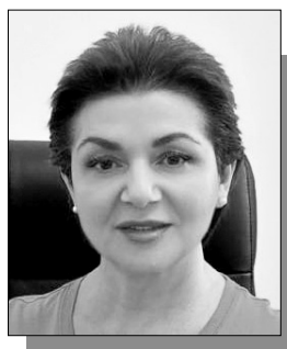
Մանրամասները՝ ArmLur.am կայքում: