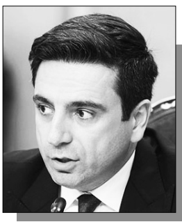
Շարունակությունը՝ ArmLur.am կայքում: