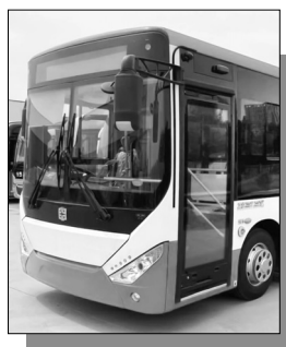
Շարունակությունը՝ ArmLur.am կայքում: