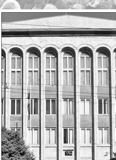
Նա չորեքշաբթի՝ հոկտեմբերի 9-ին՝ ժամը 12:00-ին, դատախազության մոտ: ԶՈՒՍՏԻՆԱ ՍՈՒՇԵՐԱՅԱ

Բագրատ Սրբազանը հայտարարեց, որ շարժման հաջորդ հավաքը տեղի կունե-