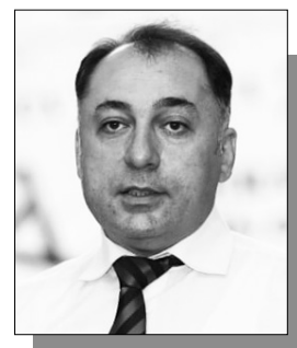
Շարունակությունը՝ ArmLur.am կայքում:

Թեև փաստաթղթերով կամ իրականում ԱԺ նախագահի եղբայր Կառլեն Սիմոնյանը այլևս կապ չունի միլիարդավոր դրամների տեղերներ շահած «Եվրոասֆալտ» ՓԲԸ-ի հետ, սակայն այժմ «Դատալեքս»-ն է ողողված հիշյալ ընկերության դեմ տարատեսակ հայցերով՝ ֆիզանձերից մինչև բանկերին փոխկապակցված կազմակերպություններ եւ ապահովագրական ընկերություններ: «Արինս Կապիտալ», «Ռոգո ինչուրանս», «Արգիշտի 2», «Վիկան», «Բետոնագործ», Սեւակ Բոյաջյան եւ գուցե այլք փորձում են արդարադատություն գտնել «Եվրոասֆալտի» դեմ պայքարում: «Ժողովուրդ»-ը կհետեւի սույն դատական գործերի ընթացքին՝ հասկանալու, թե Ալեն Սիմոնյանի բանակի ընկերը ինչքան է թույլ տվել: