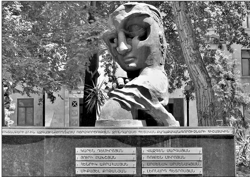
ՈԿՏԵՄԲԵՐԻ 27-Ի ԱԳԱՅԻՆ ԺՊՈՂՎՈՐ ՈՏՐՎՈՐԾՈՒՅՑՆ ԶՈՂՈՒՄՈՍ ՊԵՏԱԿԱՆ ԲԱՆԱԲԱՅՎԱԿԱՆ ԳՈՐԾԻ ԶԵՆՔԻՆ

Քննության ընթացքում հարցաքննվել են նաեւ ահաբեկչական խմբի անդամներ, դատապարտյալներ Կարեն Հունանյանը, Դերենիկ Բեջանյանը եւ Աշոտ Վկայաչյանը: Համապատասխան քրեակատարողական հիմնարկներից առգրավվել են խմբի մյուս անդամներ Էդուարդ Գրիգորյանի, Վռամ Գալստյանի եւ Համլետ Ստեփանյանի անձնական գործերը՝ նրանց մահվան պատճառների վերաբերյալ մի շարք հարցեր պարզաբանելու համար: