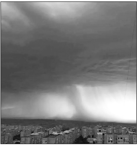
Ամպրոպի եւ կայծակի 7 դեպք է գրանցվել, որից տուժել է 5 մարդ, 3-ը վիրավորվել են, 2-ը՝ զոհվել: Տարհանված անձինք չեն եղել:

Ուժեղ քամու, փոթորիկի, մրրիկի, պտտահողմի, փոշեփոթորիկի 99 դեպք է գրանցվել 2023 թվականին, որի պատճառով տարհանվել է 3 մարդ: Տուժած մարդիկ չկան: