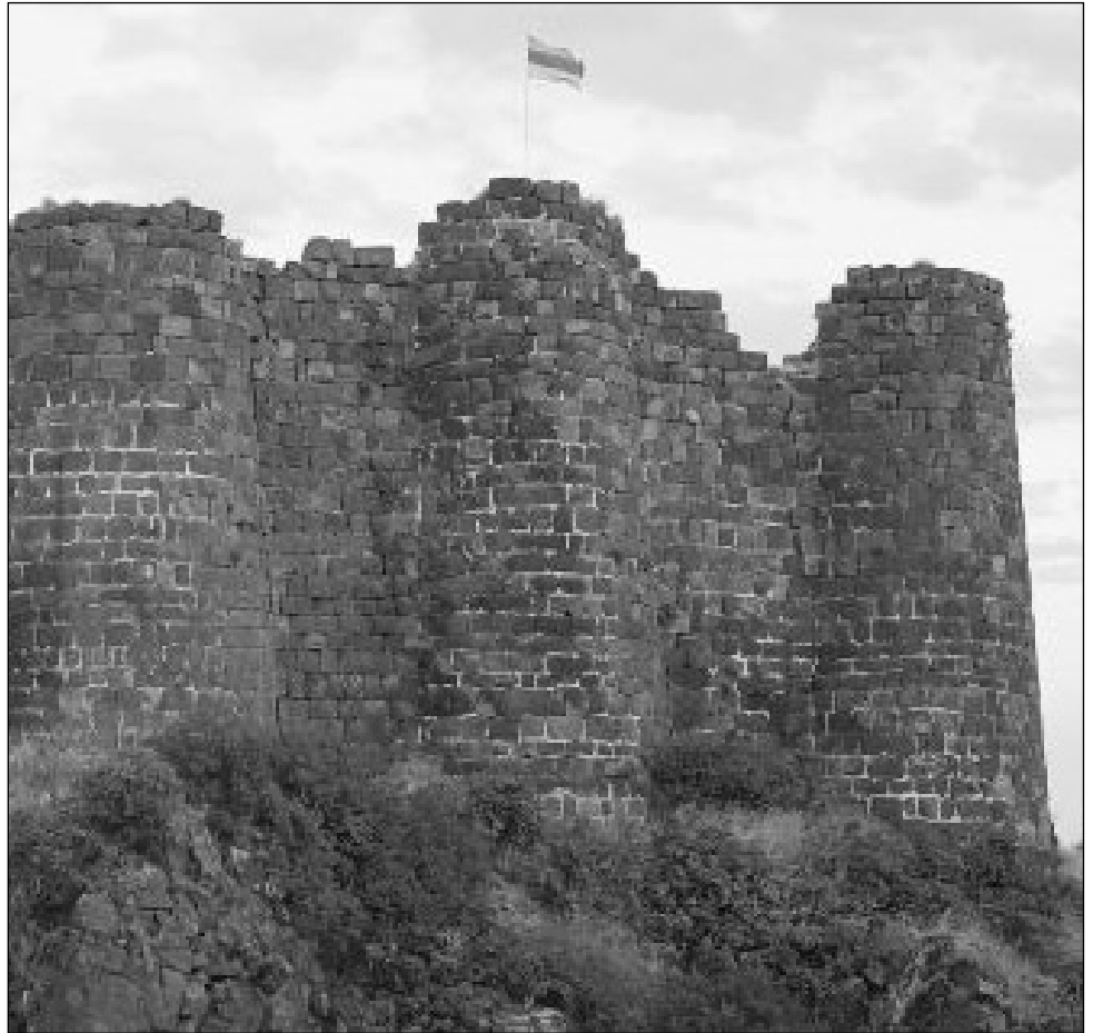
Ամուշ և (Ժամանակակից աղբյուրներից հայտնաբերված պատմագրությունը փորձում է աղբյուրներից...