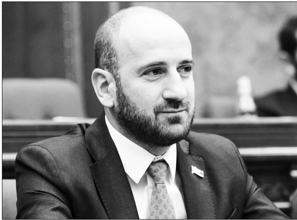
Իսկ եթե վարչապետը Ձեզ դիմեր նման խնդրանքով, Ձեր մանդատը վայր կդնե՞իք:

Մենք բոլորս կուսակցական ենք, եւ կան ընդհանուր խաղի կանոններ: