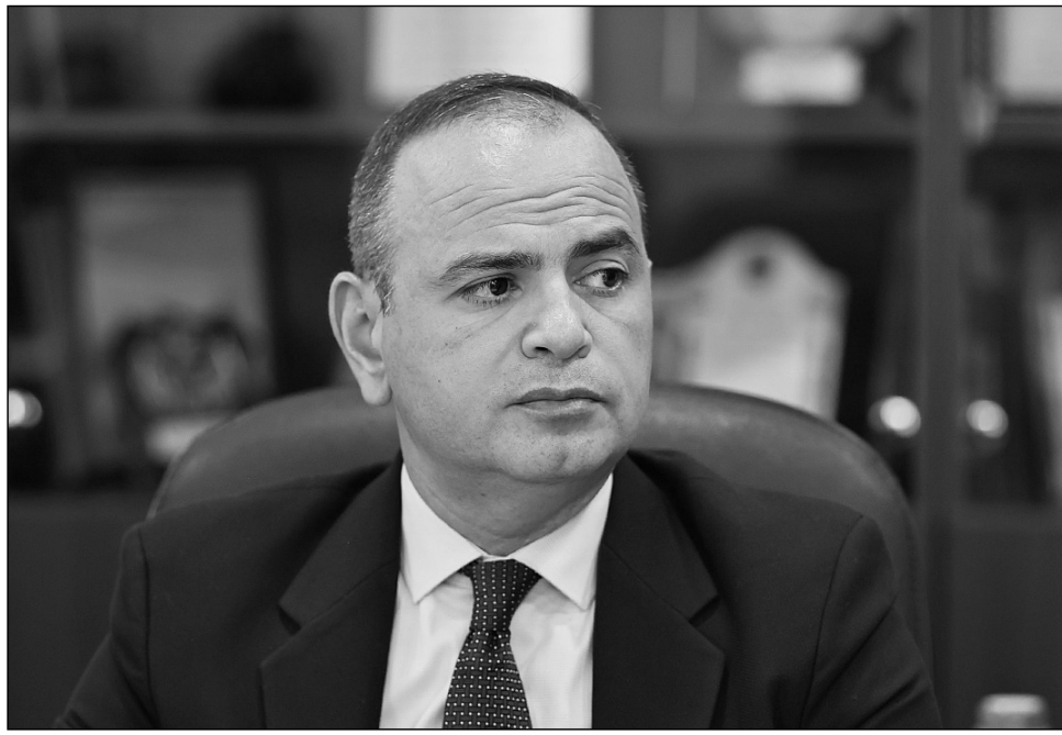
Որ տեղափոխվելով Լիբանանի մայրաքաղաք Բեյրութ: Ի վերջո ինչ է սպասվում հայ համայնքին:

Մերձավոր արեւելքում դեռևս 15 տարի առաջ սկսված լարվածությունը նոր փուլ է մտել: «Արաբական գարուն» անվանումը ստացած աշխարհափոփոխական զարգացումների շրջանում իր ուրույն տեղն ունի Սիրիան, որտեղ դասերազմը կարելի է համարել «ավարտված»: