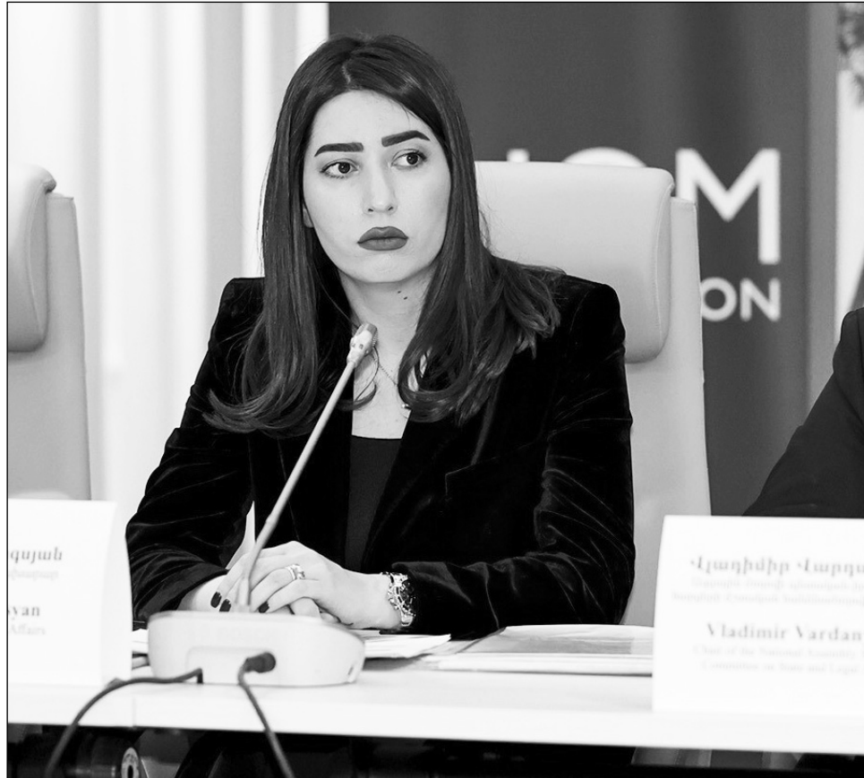
Վարական մոտեցումներ որդեգրելու համար:

Ըստ նախարարի՝ բնակչության պետական ռեգիստրը պետք է ինքնին որոշակի ծառայությունների մատուցման աղբյուր լինի եւ լինի պետության ձեռքում հուսալի գործիք՝ տարբեր ոլորտային ռազմա-