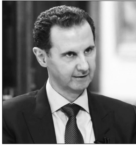
Այս ամենի արդյունքում, ղեկավարների 12-ին հայտնի դարձավ, որ Թուրքիայի և Բաթրի պատվիրակությունները Ռամասկոսում հանդիպելու են թուրքական աջակցություն վայելող ահաբեկչական «Հայաթ Թահիր ալ Շամ» խմբավորման ղեկավար Աբու Մուհամմադ ալ Ջուլանիի հետ: Նրա նկատմամբ միանգամից փոխվեց միջազգային վերաբերմունքը՝ հատկապես արեւմտյան պետությունների կողմից:

Ֆրանսիայում հեռավոր դասավորված կրկին ձեռքարկության օրեր են արձակել Սիրիայի նախկին նախագահ Բաշար ալ Ասադի նկատմամբ՝ 2017 թվականին Արաբական Հանրապետությունում հաղափարական օբյեկտների ոմբակոծմանը ենթարկյալ մեղաանցության համար, հայտնում է Agence France-Presse-ը: