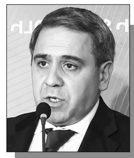
Շարունակությունը՝ ArmLur.am կայքում: