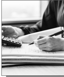
Սանրամասները՝ ArmLur.am կայքում:

Հ ամընդհանուր հայտարարագրումը ոսկոր է դարձել, ոչ միայն իշխանության, այլ նաեւ հանրության կոկորդին: Քաղաքացիները ֆինանսական միջոցները չհայտարարագրելու նոր մեթոդ են գտել: Կառավարությունը պարտադրողական թեգեր է «կերակրում» լսարանին, իսկ լսարանը բողոքում եւ բոյկոտում է: Սրան ի պատասխան, փոխարենը հայտարարագրումը դադարեցնելուն, իշխանությունը «գայթակղիչ» առաջարկներ է անում. օրինակ՝ «Հայտարարագրե՞ք ձեր երեխայի ուսման համար վճարված գումարը, եւ դրա փոխարեն կվերադարձվի 100 հազար դրամ»: Իսկ հայտարարագիր չլրացնելու դեպքում՝ ամեն բան այդքան էլ սարսափելի չէ: Հայտարարագրում առկա թերի տվյալների համար անձը կարող է այն լրացնել 2-րդ անգամ: Անձին եւս մեկ շանս տալիս է Պետական եկամուտների կոմիտեն շտկման համար: 3-րդ դեպքում՝ քաղաքացիներին կտրվի նախագաղափար: 4-րդ դեպքում, շտկումները չուղղելուց հետո, քաղաքացին տուգանվում է 5.000 դրամ, իսկ 1 մլրդ համախառն ներքին արդյունք հայտարարագրած անձանց դեպքում տուգանքը 50 հազար դրամ կկազմի: 700 հազար հայտարարատու անձից մինչ այժմ լրացրել է 4 հազար 400 մարդ, իսկ մյուսները նախընտրում են տուգանվել 5.000 դրամ եւ այլեւս չլրացնել հայտարարագիր: