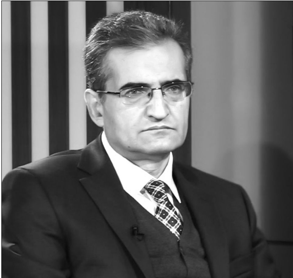
Նախագահը, երկուսն էլ, մեկնել են գործուղման: Այս դեպքում ո՞վ պետք է կատարի ղեկավարի պարտականությունները...