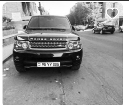
$16,000 Land Rover Range Rover Sport, 5.0 Լ, [ի... Կենտրոն, 2010 թ. 200,000 կմ, Բենզին

թյունը միայն 14 ամիս հետո որոշել է այդ գույքը դնել աճուրդի: Այսինքն՝ 14 ամիս է տեւում մի մեքենա աճուրդով դնելը: Եվ ամենակարեւորը՝ Դատարանը այդ մեքենան հաշվել է 10,200,000 դրամի փոխարեն, իսկ մեքենան աճուրդի է դրվում 5,500,000 դրամով: Երկու գնահատումն էլ արել են պետական կառույցները: Այսինքն, դեռ բավական չէ, որ մեքենան ապօրինի ճանաչված գույքի դիմաց ոչինչ է, մյուս կողմից՝ այս գործընթացը մեկնարկել է դեռ վաղուց, սակայն հասարակությանը դեռ չէր հայտնվել: Նշենք, որ հեշտությամբ պետությանը վերադարձված ավտոմեքենան պատկանել է Երեւանի Էրեբունի վարչական շրջանի նախկին թաղապետ Արմեն Հարությունյանին, որը ԱԺ նախկին պատգամավոր Միեր Սեդրակյանի քրոջ որդին է: