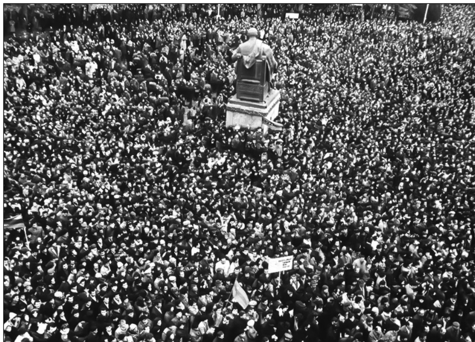
հավաքի անուկից դիմելու են Մինսկի խմբի ռեանսիազահներին:

Ըստ ArmLur.am-ի գրուցակցի՝ այսօր հնարավորություն է ստեղծվում վերականգնել Մինսկի խմբի համախառն հույսերի ֆորմատը՝ հաշվի առնելով Թրամփի և Պուտինի միջև արդեն սկսված երկխոսությունը: Ըստ Սարգսյանի՝ «Մինսկի խմբի գործունեությունը մեզ համար կարևորագույն գործն է»: