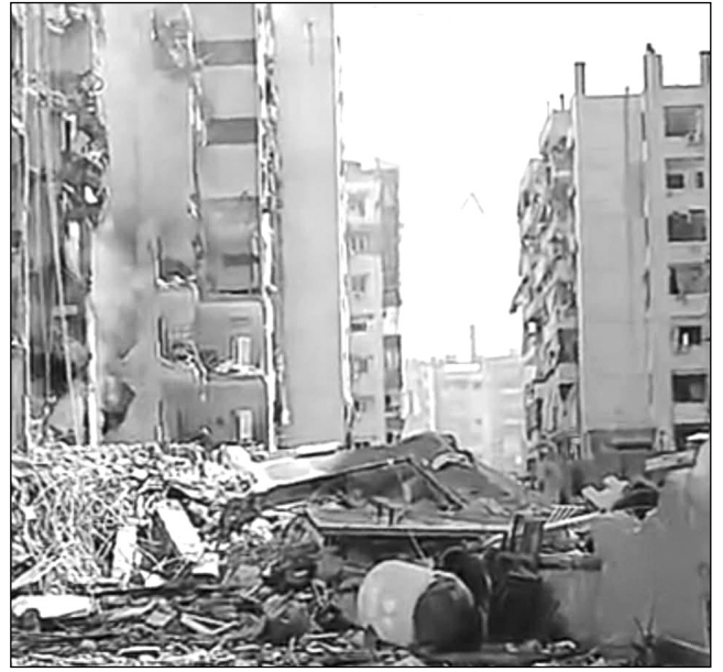
Լիբանան. մեր օրեր...