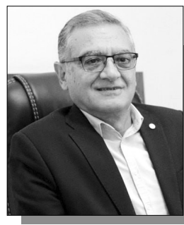
Շարունակությունը՝ ArmLur.am կայքում

«Ժողովուրդ» օրաթերթի լրագրողը երեկ հարց ուղղեց ՀՀ վարչապետ Նիկոլ Փաշինյանին՝ բանակում չճանաչած պաշտոնյաների եւ նրանց հարազատների թեմայով: Շուրջ 15 տարի հրապարակումներ է անում «Ժողովուրդ»-ը բանակում չճանաչած պաշտոնյաների եւ նրանց արտոնյալ որդիների մասին: Վարչապետի ուշադրությունը հրավիրեցինք եւս երկու դեպքերի վրա: Առաջինը վերաբերում է Արմեն Նիկողոսյանին, ով նախկինում աշխատել է վարչապետի ղեկավարած թերթում որպես սպորտային լրագրող, իսկ այժմ զբաղեցնում է Հայաստանի ֆուտբոլի ֆեդերացիայի փոխնախագահի պաշտոնը: Լրագրողը նշեց, որ մամուլում հրապարակումներ են եղել այն մասին, թե Նիկողոսյանի որդին եւ եղբորորդին ազատվել են պարտադիր զինծառայությունից: Ըստ հրապարակումների՝ որդին բանակից ազատվել է ֆուտբոլիստ լինելու հիմքով, ինչի վերաբերյալ թերթը հարցում է ուղարկել ՀՀ պաշտպանության նախարարություն, սակայն պատասխան չի ստացել՝ անձնական տվյալների պահպանման պատճառաբանությամբ: