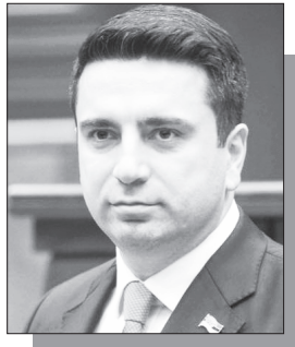
Շարունակությունը՝ ArmLur.am կայքում

«Ժողովուրդ» օրաթերթը ՀՀ գլխավոր դատախազ Աննա Վարդապետյանին ենթադրյալ հանցանքի մասին հաղորդում էր ներկայացրել այս տարվա փետրվարի 11-ին՝ հիմքում դնելով ԱԺ պատգամավոր Հայկ Սարգսյանի հրապարակային հայտարարությունները, որոնցում նա կասկածի տակ է դրել ԱԺ նախագահ Ալեն Սիմոնյանի վարքը եւ շահագրգռվածությունը բուքմեյքերական ոլորտի նկատմամբ: Ըստ պատգամավորի՝ ոլորտում ներգրավված որոշ խոշոր սեփականատերեր ԱԺ նախագահի մտերիներն են: Այս հայտարարությունները, որոնք արվել են հրապարակային հարթակում, ըստ էության, պարունակում են ոչ միայն քաղաքական գնահատական, այլ նաեւ քրեաիրավական հնարավոր տարրեր՝ շահերի բախումից մինչեւ պաշտոնեական լիազորությունների չարաշահում: ՀՀ հակակոռուպցիոն կոմիտեն, արձագանքելով մեր դիմումին, նախ տեղեկացրել էր, որ քրեական վարույթ նախաձեռնելու հիմքեր չեն հայտնաբերվել: Սակայն նույն օրը մեկ այլ գրությամբ տեղեկացրել է, որ «դիմումի մեջ նշված հանգամանքները պարզելու ուղղությամբ ձեռնարկվել են համապատասխան օպերատիվ-հետախուզական միջոցառումներ եւ ստուգողական գործողություններ, որոնք դեռեւս շարունակվում են»: