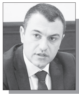
Մանրամասները՝ ArmLur.am կայքում

ՀՀ Կադաստրի կոմիտեի ղեկավար Սուրեն Թովմասյանը պաշտոնին նշանակվել է 2019 թվականին եւ այն եզակի պաշտոնյաներից է, որը իշխանության ձեւավորման փուլից ի վեր շարունակում է զբաղեցնել նույն պաշտոնը: Թովմասյանը Փաշինյանի սրտի պաշտոնյաներից է, քանի որ երբ վարչապետը հայտարարում էր, որ Հայաստանը չունի կադաստրի վկայական, Թովմասյանը լուռ հետեւում էր հանրության վրդովմունքին՝ ըստ էության համաձայնելով առանց կադաստրի երկրի Կադաստրի պետը լինելու հետ: «Ժողովուրդ» օրաթերթը ուսումնասիրեց Սուրեն Թովմասյանի 2024 թվականի տարեկան հայտարարագիրը եւ պարզեց, որ պաշտոնյան հայտարարագրել է մի քանի միավոր անշարժ գույք, բանկային զգալի միջոցներ, ինչպես նաեւ վարկային պարտավորություններ: Ըստ հայտարարագրի՝ Թովմասյանը ունի ընդհանուր առմամբ 4 միավոր անշարժ գույք՝ դրանցից երեքը բազմամյա տնկիներ են Արարատի մարզի Փոքր Վեդի համայնքում, իսկ մեկը՝ Երեւանում գտնվող անհատական բնակելի տուն: Սուրեն Թովմասյանը տրանսպորտային միջոցներ չի հայտարարագրել: «Ժողովուրդ» օրաթերթը ուսումնասիրեց նաեւ պաշտոնյայի ֆինանսական տվյալները եւ պարզեց, որ նա չունի կանխիկ դրամ, սակայն ունի տարբեր բանկային հաշիվներում կուտակված միջոցներ: