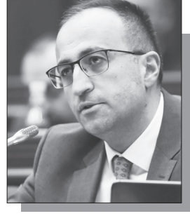
Շարունակությունը՝ ArmLur.am կայքում

Ստորագրողական ոլորտում աճում են ընդդիմադիր տրամադրությունները: «Ժողովուրդ» օրաթերթի տեղեկություններով՝ իշխանության ներսում փակ քննարկումներ են անցկացվել երկու նախարարությունների հնարավոր վերամիավորման թեմայով: Խոսքը վերաբերում է ՀՀ աշխատանքի և սոցիալական հարցերի նախարարության և ՀՀ առողջապահության նախարարության հնարավոր միավորմանը, որի վերաբերյալ, ըստ նույն աղբյուրի, արդեն շրջանառվում է ներքին նախագիծ: Թերթի տեղեկություններով՝ նախաձեռնության հիմնական ջատագովը համարվում է աշխատանքի և սոցիալական հարցերի նախարար Արսեն Թորոսյանը, որը ձգտում է սոցիալական և առողջապահական ոլորտների կառավարման մոդելը կենտրոնացնել մեկ գերատեսչության շրջանակում՝ իր ձեռքին: Ըստ «Ժողովուրդ»-ի աղբյուրների՝ համակարգի ներսում արդեն նկատվում է անհանգստություն հնարավոր կառուցվածքային փոփոխությունների շուրջ: Խոսքը վերաբերում է հատկապես առողջապահության ոլորտում ներգրավված տասնյակ հազարավոր աշխատակիցներին, որոնք անհանգիստ են հնարավոր օպտիմալացումների հեռանկարով: