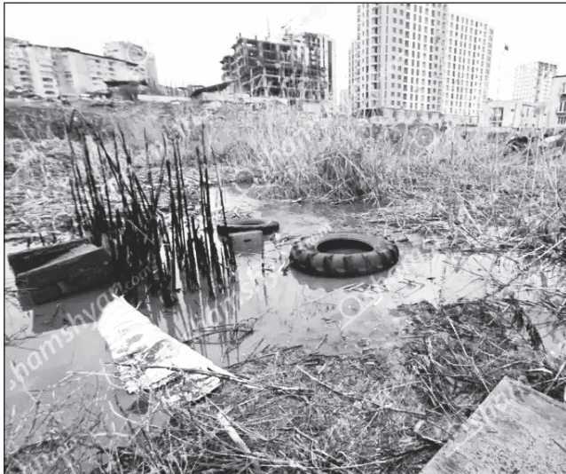
Առինջ բնակավայրում ստեղծվել է կեղտաջրերի «միսի լճակ»: