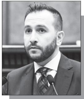
⇒ էջ 3

ՀՀ դատախազությունը «Հետք»-ի հրապարակումն ուղարկել է Հակակոռուպցիոն կոմիտե: «Ժողովուրդ» օրաթերթը պաշտոնապես տեղեկացավ, որ Առինջի կառուցապատման աղմկահարույց գործով ստուգողական գործողություններ են ընթանում. «մակուլատուրան ստուգվում է»: «Ժողովուրդ»-ը տեղեկացրել էր, որ ՀՀ դատախազությունը «Հետք»-ի հրապարակումը, որը վերաբերում է Առինջում կառուցված շենքերի եւ առանձնատների գործին, ուղարկել է Հակակոռուպցիոն կոմիտե՝ քրեական վարույթի ընթացքը լուծելու նպատակով: Խոսքը վերաբերում է այն աղմկահարույց պատմությանը, որի շրջանակում բացահայտվել էր Առինջում կառուցապատված թաղամասի կոռուպցիոն շղթան: Ըստ հրապարակման՝ Առինջում «Միլոն մայնիկ» ՍՊԸ-ի կառուցած թաղամասում ԱԺ ԶՊ խմբակցության ղեկավար Հայկ Կոնջորյանը դեռեւս 2025 թվականի դեկտեմբերին մատչելի պայմաններով ձեռք էր բերել բնակելի տուն՝ թաունհաուս: Ուշագրավն այն է, որ Կոնջորյանը գույքը ձեռք էր բերել շուկայականից եւ նույնիսկ կառուցապատողի հայտարարած գնից էժան՝ մեկ քառակուսի մետրի համար վճարելով ընդամենը 300 հազար դրամ, այն դեպքում, երբ վաճառքի հայտարարված գինը կազմել էր 420 հազար դրամ: