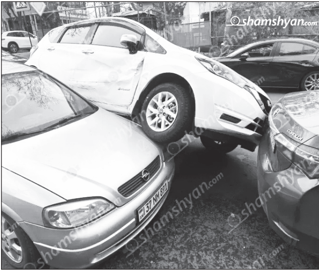
Ավտոմոբիլ էրեւանում. «Nissan»-ը մասամբ հայտնվել է «Opel»-ի վրա: