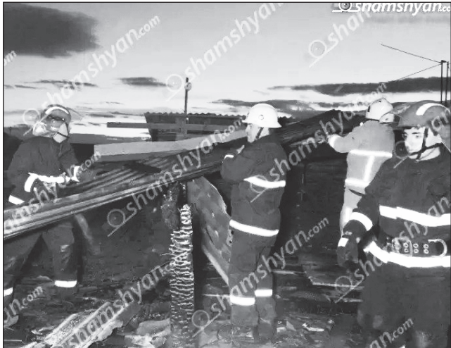
Խոշոր հրդեհ Երեւանում Նորք-Մարաշում. կրակն ու ծուխը տեսանելի էին մի քանի կմ-ից: