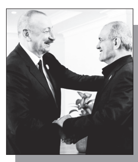
⇒ էջ 3

Իրանի նախագահ Մասուդ Փեզեշքիանը եւ Ադրբեջանի նախագահ Իլհամ Ալիևը նախորդ օրը՝ ուշ երեկոյան, հեռախոսազրույց էին ունեցել՝ քննարկելով Իրանի շուրջ սրվող իրավիճակը եւ դրա ազդեցությունը տարածաշրջանային անվտանգության վրա: Զրույցի ընթացքում Փեզեշքիանը ներկայացրել է ԱՄՆ-ի եւ Իսրայելի կողմից Իրանի դեմ իրականացվող հարվածների վերջին զարգացումները՝ նշելով, որ թիրախավորվել են նաեւ քաղաքացիական օբյեկտներ, այդ թվում՝ դպրոցներ, հիվանդանոցներ եւ կարեւոր ենթակառուցվածքներ: Նրա խոսքով՝ լարվածության աճը տեղի է ունեցել այն պայմաններում, երբ Թեհրանը բանակցություններ էր վարում Վաշինգտոնի հետ: Իրանի նախագահն ընդգծել է, որ երկիրը վճռական է պաշտպանել իրեն բոլոր հնարավոր միջոցներով: