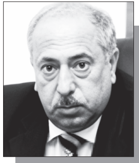
⇒ էջ 4

Երեկ հայտնի դարձավ, որ Վազգեն Սահակյանը դատավոր չի նշանակվի: ՍԴ-ն բավարարել է 33 նախագահ Վահագն Խաչատրյանի դիմումը՝ Բարձրագույն դատական խորհրդի՝ 2026 թվականի մարտի 12-ի թիվ ԲԴԽ-27-Ո-24 որոշմամբ 3անրապետության նախագահին ներկայացված առաջարկությունը ճանաչելով Սահակյանի 175-րդ հոդվածի 1-ին մասի 2-րդ կետին հակասող: Հիշեցնենք, որ Վազգեն Սահակյանին Սյունիքի մարզի ընդհանուր իրավասության դատարանի դատավոր նշանակելու առաջարկ ԲԴԽ-ն 33 նախագահին ներկայացրել է մարտի 12-ին: 33 նախագահը, սակայն, չի ստորագրել նշանակման հրամանագիրը եւ դիմել է ՍԴ՝ վիճարկելով սահմանադրականության հարցը: Մենք հայտնել էինք, որ թեկնածուի բարեվարքությունը այնքան էլ լավ չի գնահատվել, սակայն ԲԴԽ-ն ներկայացրել էր նրա թեկնածությունը՝ առանց լուրջ հիմնավորումների: Հիշեցնենք, որ մերժված դատավորի հայրը վերաքննիչ քրեական դատարանի նախագահ Տիգրան Սահակյանն է, որը 2008 թվականից մինչև 2016 թվականը զբաղեցրել է 33 վերաքննիչ քրեական դատարանի նախագահի պաշտոնը, սակայն աղմկալի պատմության արդյունքում նրա հետ գործարքի գնացին ու հանեցին նախագահի պաշտոնից: