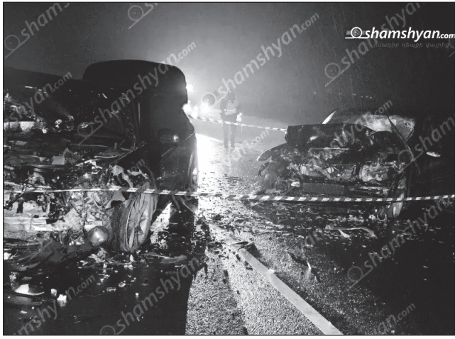
Որբերգական ավտոկար Կոտայքի մարզում. ճակատ ճակատի բախվել են «Mercedes»-ները, կա 1 զոհ, 5 վիրավոր: