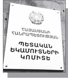
Շարունակությունը՝ ArmLur.am կայքում

ՀՀ հակակոռուպցիոն կոմիտեի կողմից իրականացված օպերատիվ-հետախուզական միջոցառումների արդյունքում նախաձեռնված քրեական վարույթով պարզվել է, որ ՀՀ պետական եկամուտների կոմիտեի համալիր հարկային ստուգումների վարչության գլխավոր հարկային տեսուչի պաշտոնը զբաղեցրած անձը տնտեսվարողների օգտին ապօրինի գործողության եւ անգործության համար ստացել է խոշոր չափերի, ընդհանուր՝ 10.500 ԱՄՆ դոլար եւ 3.000.000 ՀՀ դրամ կաշառք: Մասնավորապես, պարզվել է, որ վերը նշված պաշտոնատար անձը հասարակական կազմակերպությունում իրականացվող հարկային ստուգումը ՀՀ-ի օգտին անցկացնելու եւ առկա խախտումները չարձանագրելու համար կազմակերպության տնօրենից ընդունել է խոշոր չափերով՝ 8.000 ԱՄՆ դոլար կաշառք տալու առաջարկը: Արդյունքում հարկային տեսուչը տնօրենից 2025 թվականի նոյեմբեր եւ դեկտեմբեր ամիսներին մաս-մաս ստացել է կաշառքի ընդհանուր գումարից 6000 ԱՄՆ դոլարը: