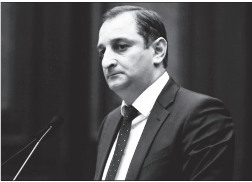
Միաժամանակ ArmLur.am-ը պարզեց, որ պաշտոնյան ունի նաեւ վարկային պարտավորություններ: