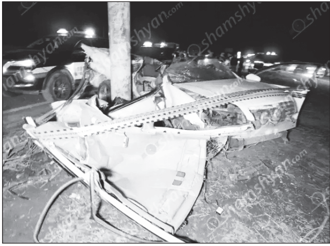
Որբերգական ավտովթար Կոտայքի մարզում. «Շանգրի-Լա»-ի հարեւանությամբ կա 1 զոհ, 2 վիրավոր. ավտոմեքենան վերածվել է մետաղե ջարդոնի: