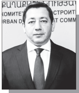
Մանրամասները՝ ArmLur.am կայքում

«Ժողովուրդ» օրաթերթը ուսումնասիրել է Քաղաքաշինության կոմիտեի նախագահ Եղիազար Վարդանյանի հայտարարագրերը եւ պարզել մի շարք ուշագրավ տվյալներ նրա գույքի, եկամուտների եւ ֆինանսական պարտավորությունների վերաբերյալ: Նշենք, որ Եղիազար Վարդանյանը 2024 թվականի մարտի 21-ին նշանակվել է Քաղաքաշինության կոմիտեի նախագահ, իսկ պաշտոնը ստանձնել է 2024 թվականի մարտի 22-ին: Ըստ հայտարարագրի՝ պաշտոնը ստանձնելու օրվա դրությամբ Վարդանյանն ունեցել է՝ հողամաս Կոտայքի մարզի Ծաղկաձոր համայնքում (ձեռք բերված 02/08/2011, գնմամբ), անհատական բնակելի տուն Երևանում (ձեռք բերված 25/04/2012, գնմամբ): Նա նաեւ ունեցել է՝ «Մերարմինվեսթ» ՍՊԸ-ին տրամադրված փոխառություն՝ 27,109,152.5 դրամ, բանկային հաշիվներում՝ 940,171 դրամ, կանխիկ միջոցներ՝ 14,400 եվրո, 26,800 ԱՄՆ դոլար եւ 39,500,000 դրամ: