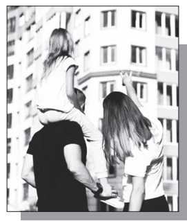
Շարունակությունը՝ ArmLur.am կայքում

E-draft հարթակից «Ժողովուրդ» օրաթերթը տեղեկացավ, որ հանրային քննարկման է ներկայացվել «6 եւ ավելի անչափահաս երեխա ունեցող ընտանիքների բնակարանային ապահովման պետական աջակցության ծրագիրը եւ ծրագրի իրականացման կարգը հաստատելու մասին» Հայաստանի Հանրապետության կառավարության որոշման նախագիծը: Այն ներկայացվել է 02.04.2026-ին, իսկ հանրային քննարկման վերջնաժամկետը սահմանված է 17.04.2026-ը: «Ժողովուրդ»-ը ուսումնասիրեց ներկայացված նախագիծը եւ պարզեց, որ այն ուղղված է բազմազան ընտանիքների բնակարանային խնդիրների լուծմանը եւ բնակարանային հասանելիության բարձրացմանը: Նախագծի հիմնավորման մեջ նշվում է, որ ներկայում գործող ծրագրերը լիարժեք չեն լուծում նման ընտանիքների խնդիրները, քանի որ գործող աջակցությունը հիմնականում միանվագ է եւ չի ծածկում հիփոթեքային վարկերի ամբողջական բեռը: