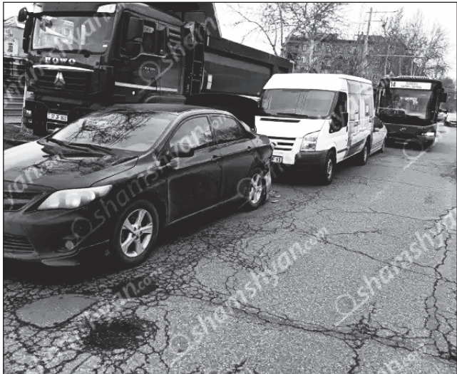
Շրթայական ավտովթար Երեւանում: