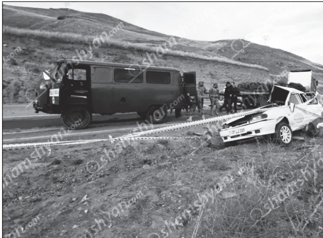
Որբերգական ավտոթափ Սպիտակ-Վանաձոր ճանապարհին. մահացածները ԶԶ ՊՆ զինծառայողներ էին: