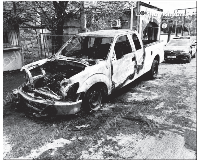
Հրդեհ կայանված Ford (Pickup) մեքենայում: