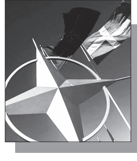
Շարունակությունը՝ ArmLur.am կայքում

Շվեդիայի կառավարությունը հայտարարել է, որ պատրաստվում է ստեղծել Նոր հետախուզական ծառայություն՝ ուղղված արտաքին սպառնալիքների բացահայտմանը, ինչը պայմանավորված է Ուկրաինայում ընթացող պատերազմի հետեւանքով անվտանգության միջավայրի վերագնահատմամբ: Երկրի արտգործնախարար Մարիա Մալմեր Ստեներագարդը հայտարարել է, որ Նոր կառույցը կկրի «Շվեդիայի արտաքին հետախուզական ծառայություն» (UND) անվանումը եւ կսկսի գործել 2027 թվականի հունվարից: Նրա խոսքով՝ Ուկրաինայում ընթացող պատերազմի պայմաններում առավել ակնհայտ է դարձել, որ տեղեկատվական առավելությունն ու տեխնոլոգիական համակարգերին արագ հարմարվելու կարողությունը նույնքան կարեւոր են, որքան ժամանակակից սպառազինությունը: Ստեներագարդը նշել է, որ Նոր ծառայությունը գործառնություններով համադրելի կլինի Մեծ Բրիտանիայի արտաքին հետախուզական ծառայության՝ MI6-ի հետ: Ներկայում Շվեդիան արդեն ունի ռազմական հետախուզական ծառայություն՝ MUST-ը, որը զբաղվում է արտաքին սպառնալիքներով, ինչպես նաև ոչ ռազմական անվտանգության ծառայություն՝ SAPO-ն, որը կենտրոնացած է ներքին վտանգների վրա: