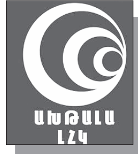
Շարունակությունը՝ ArmLur.am կայքում

«Ժողովուրդ» օրաթերթի հարցմանն ի պատասխան՝ ՏԿԵ նախարարությունը փաստացի հաստատում է, որ այս տարվա հունվարին «Ախթալայի ԼՀԿ» ՓԲԸ-ում իրավիճակն այնքան էր սրվել, որ իշխանությունները ստիպված են եղել ներգրավել աշխատակիցների եւ ղեկավարության միջեւ բանակցություններին: Թեեւ գերատեսչությունը խուսափում է անդրադառնալ «արհեստական գործադուլի» եւ հնարավոր սաբոտաժի մասին հարցադրումներին, պատասխանից ակնհայտ է դառնում հանրային առկա դժգոհությունները ստիպել են ընկերությանը վերանայել աշխատավարձերն ու աշխատանքային պայմանները: «Ժողովուրդ» օրաթերթը ՀՀ տարածքային կառավարման եւ ենթակառուցվածքների նախարար Դավիթ Խուդաթյանից փորձել էր պարզել, թե ինչ տեղեկություններ ունի գերատեսչությունը Ախթալայի հանքի շուրջ վերջին շրջանում շրջանառվող լուրերի վերաբերյալ, մասնավորապես հնարավոր արհեստական գործադուլների եւ սաբոտաժի դրսևորումների մասին: Ի պատասխան՝ նախարարությունը հայտնել է, որ այս տարվա հունվարին «Ախթալայի ԼՀԿ» ՓԲԸ-ում տեղի ունեցած բողոքի ակցիայի շրջանակներում ՏԿԵ նախարարությունը եւ Լոռու մարզպետի աշխատակազմը հանդիպումներ ու քննարկումներ են ունեցել ընկերության աշխատակիցների եւ ղեկավար կազմի հետ: