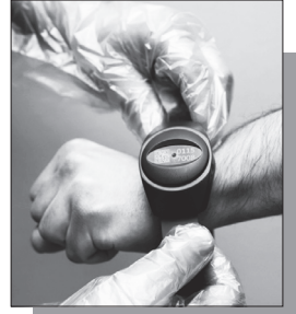
Մանրամասները՝ ArmLur.am կայքում

Մ ինչ իշխանությունները քաղաքական գործերով անցնող անձանց նկատմամբ ցուցադրում են գրեթե շուրջօրյա վերահսկողություն, պարզվում է՝ ընդամենը մեկ տարվա ընթացքում տնային կալանքի տակ գտնվող անձանցից արձանագրվել է 23 փախուստի դեպք: Ավելին՝ Պրոբացիայի ծառայությունն անգամ վիճակագրություն չունի՝ այդ անձինք հայտնաբերվել են, թե՛ ոչ: «Ժողովուրդ» օրաթերթը հարցում էր ուղարկել ՀՀ արդարադատության նախարար Սրբուհի Գալստյանին, եւ հարցմանն ի պատասխան՝ ՀՀ արդարադատության նախարարությունը հայտնել է, որ 2025 թվականին Պրոբացիայի ծառայությունում տնային կալանք այլընտրանքային խափանման միջոցով հաշվառվել է 2053 անձ, իսկ ներկայում տնային կալանքի տակ է գտնվում 951 մարդ: Սակայն առավել ուշագրավը փախուստների վերաբերյալ տվյալներն են: Պաշտոնական պատասխանի համաձայն՝ 2025 թվականի հունվարի 1-ից մինչեւ 2026 թվականի մարտի 31-ն ընկած ժամանակահատվածում արձանագրվել է տնային կալանքի տակ գտնվող անձանց 23 փախուստի դեպք: Այլ կերպ ասած՝ տնային կալանքի համակարգից մարդիկ պարզապես հեռացել են, որոշ դեպքերում կատարել կրկնակի հանցագործություններ: