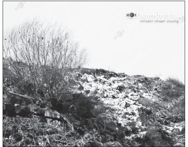
Նոր Հաճնում գտնվող բնության գողտրիկ անկյունը վերածվում է աղբանոցի: