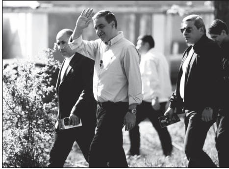
Բժիշկը՝ երկու տարին մեկ անգամ, իսկ պետական ծառայողը՝ մշտապես ու այս ամենը պետք է լինի անվճար:

Հայասանը կորցնում է մարդկանց, երիտասարդները հեռանում են, որովհետև իրենց կարողություններին համադասարան շուկա այստեղ չկա: Ընթացիկները հեռանում են երեխաների ծնունդը, կնոջ համար երեխայի եւ կրթության միջոց ընտրությունը վերածվել է ծուղակի: Մեծանուն ուսուցիչը երբեմն ավելի շատ հարկ է վճարում, քան երեխանունը քիզնու եկամուտներով ապրող ընկերության սեփականատերը, եւ միաժամանակ իր երեխային ուղարկում է դպրոց, որտեղ ֆիզիկայի ուսուցիչ չկա: Այսպես կառուցված է: Գա կարգախոսով չես փոխի: