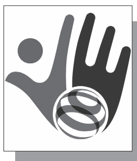
Մանրամասները՝ ArmLur.am կայքում

Վարչական ռեսուրսի հնարավոր չարաշահման վերաբերյալ «Ժողովուրդ» օրաթերթի հարցմանը Կոռուպցիայի կանխարգելման հանձնաժողովի պատասխանը ոչ թե պարզաբանում է տալիս, այլ ցուցաբերում է պետական ինստիտուտների ամենավտանգավոր արատներից մեկը՝ պատասխանատվությունից համակարգված խուսափումը: Հանձնաժողովը փաստացի չի վիճարկում, որ նախընտրական ելույթի ընթացքում օգտագործվել է ԱԼԾ տնօրենի հաղորդած տեղեկատվություն: Չի էլ փորձում գնահատել՝ արդյոք վարչապետի պաշտոնակատարի կողմից ուժային կառույցից ստացված տվյալների հրապարակային օգտագործումը կարող էր դիտարկվել որպես պաշտոնեական դիրքի առավելություն: Փոխարենը ամբողջ պատասխանը կառուցված է մեկ գաղափարի շուրջ. «Դա մեր լիազորությունից դուրս է»: Սակայն այստեղ առաջանում է հիմնարար հարց. եթե վարչական ռեսուրսի, պաշտոնեական դիրքի եւ պետական լծակների կիրառման քաղաքական զգայուն դեպքերում հենց Կոռուպցիայի կանխարգելման հանձնաժողովը հրաժարվում է նյութական գնահատական տալուց, ապա ո՞րն է այդ մարմնի իրական գործառնությունը: Հատկանշական է նաեւ, որ հանձնաժողովը հղում է անում սեփական՝ 2026 թվականի որոշմանը, ըստ որի՝ նախ պետք է վարչական դատարանը հաստատի իրավախախտումը, եւ միայն դրանից հետո իրենք կարող են անդրադառնալ էթիկական բաղադրիչին: