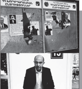
⇒ էջ 3

Չ այած ընտրություններն արդեն ավարտվել են, Երևանի եւ մարզերի մի շարք համայնքներում դեռեւս պահպանվում են թեկնածուների եւ քաղաքական ուժերի նախընտրական պաստառները: Այս հանգամանքը հարցեր է առաջացնում՝ արդյոք օրենքը պարտադրում է դրանք հեռացնել ընտրություններից հետո, եւ ով է պատասխանատու այդ գործընթացի համար: ԶԶ ընտրական օրենսգրքի 21-րդ հոդվածը սահմանում է, թե որտեղ եւ ինչ պայմաններով կարող են տեղադրվել նախընտրական քարոզչական պաստառները: Սակայն օրենսգրքի ուսումնասիրությունը ցույց է տալիս, որ գործող կարգավորումներում առանձին դրույթ չկա, որը կսահմանի ընտրությունների ավարտից հետո պաստառների պարտադիր ապամոնտաժման ժամկետը կամ պատասխանատու մարմինը: Միաժամանակ, նախկին ընտրական օրենսդրության որոշ կարգավորումներում ամրագրված էր, որ հանրային միջոցառումների ընթացքում փակցված քարոզչական պաստառները միջոցառման ավարտից հետո պետք է հեռացվեն համապատասխան թեկնածուի կամ քաղաքական ուժի կողմից: Ստացվում է, որ գործող իրավական դաշտում առկա է որոշակի բաց: