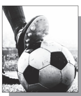
Շարունակությունը՝ ArmLur.am կայքում

«Ժողովուրդ» օրաթերթը պարզել է, որ ՀՀ կրթության, գիտության, մշակույթի եւ սպորտի նախարարությունը (ԿԳՄՄՆ) հանրային քննարկման է ներկայացրել կառավարության որոշման նախագիծ, որով նախատեսվում է ֆուտբոլի եւ ֆուտզալի ազգային հավաքականներում ընդգրկված մի շարք մարզիկների տրամադրել պարտադիր գինվորական ծառայությունից տարկետում: Նախագծի համաձայն՝ տարկետումը կտրամադրվի 2026 թվականի ամառային գորակոչից մինչեւ 2028 թվականի ամառային գորակոչը, իսկ որոշ դեպքերում՝ մինչեւ 26 տարին լրանալը: Այն վերաբերում է Հայաստանի մինչեւ 21 եւ մինչեւ 19 տարեկանների ֆուտբոլի ազգային հավաքականների, ինչպես նաեւ ֆուտզալի ազգային հավաքականի մարզիկներին: Փաստաթղթում նշվում է, որ որոշման հիմքում մարզական պատրաստության շարունակականության ապահովման անհրաժեշտությունն է: Ըստ հիմնավորման՝ պատանեկան եւ երիտասարդական տարիքում բարձր արդյունքներ գրանցած մարզիկների համար պարտադիր գինվորական ծառայությունը կարող է խաթարել մարզական առաջընթացը եւ բացասաբար անդրադառնալ նրանց միջազգային մրցունակության վրա: Նախագիծը հանրային քննարկման է դրվել 2026 թվականի հունիսի 1-ից եւ կշարունակվի մինչեւ հունիսի 16-ը: Այդ ընթացքում քաղաքացիներն ու շահագրգիռ կողմերը կարող են ներկայացնել իրենց առաջարկություններն ու դիտարկումները: