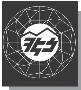
Մանրամասները՝ ArmLur.am կայքում

«Ժողովուրդ» օրաթերթի կառավարական աղբյուրների փոխանցմամբ՝ «Հայաստանի էլեկտրական ցանցեր» ընկերության (ՀԷՏ) շուրջ ընթացող գործընթացը փաստացի կատարված է եղել, մինչեւ համապատասխան դատական որոշման կայացումը: Մեր աղբյուրների տեղեկացմամբ՝ առաջիկա շաբաթներին՝ կառավարական նիստերից մեկի ընթացքում, Նախատեսվում է ընդունել որոշում, որով ՀԷՏ-ը որպես մասնավոր ընկերություն, գործադիրի որոշմամբ կճանաչվի հանրային գերակա շահ: Դրանից հետո արդեն գործադիր իշխանությունը կանցնի հաջորդ փուլին: «Ժողովուրդ» օրաթերթի տեղեկություններով՝ հանրային գերակա շահ ճանաչելուց հետո վարչապետի աշխատակազմը կմշակի գնահատման հատուկ մեխանիզմ, որի իրականացումը, ըստ մեր գրուցակիցների, կարող է տեւել շուրջ 3-4 ամիս: Գործընթացում ներգրավվելու է Հայաստանի ռեզիդենտ, լիցենզավորված գնահատող, բայց իմիջով անկախ ընկերություն, որը պետք է իրականացնի ՀԷՏ-ի շուկայական արժեքի գնահատումը: Մեր աղբյուրների փոխանցմամբ՝ գնահատման արդյունքում ձեւավորված շուկայական արժեքին կավելացվի եւս 15 տոկոս, եւ այդ վերջնական առաջարկը կներկայացվի ՀԷՏ-ի սեփականատիրոջը: Ըստ գործող սցենարի՝ հենց սեփականատերն է վերջնական որոշում կայացնելու՝ վաճառել ընկերությունը կառավարությանը, թե՛ ոչ: Բայց չվաճառելու դեպքում, միեւնոյն է, հանրային գերակա շահի հիմքով Սամվել Կարապետյանի ձեռքից Նիկոլ Փաշինյանի կառավարությունը կվերցնի ՀԷՏ-ը: