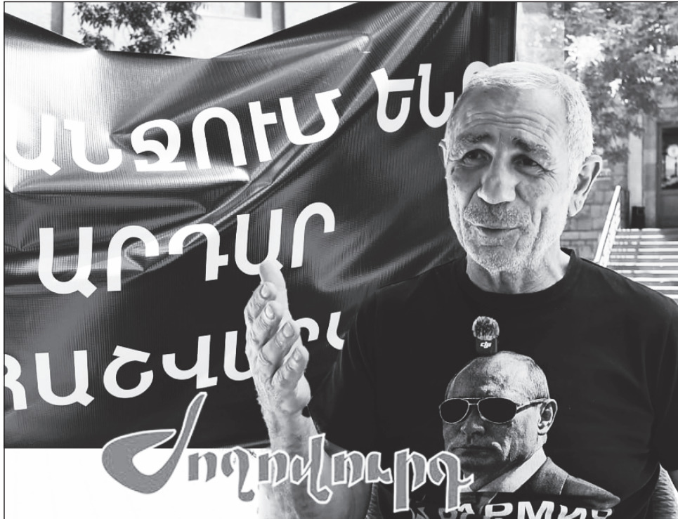
Ժողովի մոտ: Որեւէ պաշտոնյա մտեցնել է Ձեզ:

- Երեկվանից հացարդվեց իրականացնում Կենտրոնական ընտրական հանձնա-