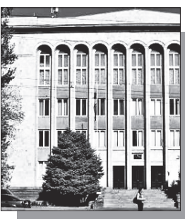
Սանրամասները՝ ArmLur.am կայքում

Սահմանադրական դատարանի դատավորները ժամանակ չունեն եւ ներքին խոսակցության ժամանակ նշել են, որ պետք է հասցնեն, քիչ ժամանակ կա, եւ հուլիսի 4-ին պետք է Սահմանադրական դատարանում ընտրությունների արդյունքների վիճարկման գործով որոշումը հրապարակեն: Հայտնի էր, որ Սահմանադրական դատարանում ընտրությունների արդյունքների վիճարկման գործով երկու դատավոր չի մասնակցի քննությանը: Խոսքն արդարադատության նախկին նախարար, «Հանրապետություն» կուսակցության նախկին անդամ Արտակ Զեյնալյանի եւ բոլորովին վերջերս «Քաղաքացիական պայմանագիր» խմբակցության պատգամավորի մանդատը վայր դրած Վլադիմիր Վարդանյանի մասին է: Ու մինչ Սահմանադրական դատարանում ընտրությունների արդյունքների վիճարկման գործով 7 դատավորները օր ու գիշեր կարդում են ներկայացված դիմումները, ընտրությունների արդյունքների վիճարկման գործընթացից դուրս մնացած 2 դատավորները՝ Արտակ Զեյնալյանը եւ Վլադիմիր Վարդանյանը, ՍԴ-ում այլ դիմումների ուսումնասիրման գործընթացով են զբաղված: Խորհրդարանական ընտրությունների արդյունքները վիճարկող յոթ քաղաքական ուժերի դիմումներով գործերը միավորել են եւ քննվելու են դատարանի նույն նիստում՝ հունիսի 26-ին: Գործով զեկուցող է նշանակվել Սահմանադրական դատարանի փոխնախագահ Էդգար Շաթիրյանը: